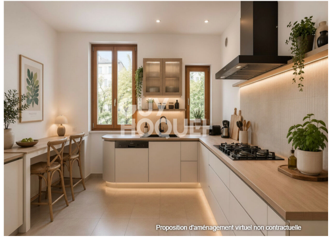
Proposition d'aménagement virtuel non contractuelle