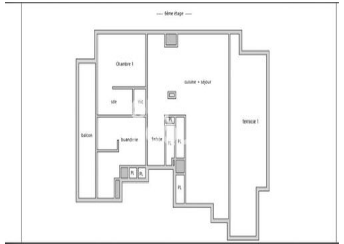
Tableau récapitulatif des surfaces de chaque pièce au sens Loi Carrez :