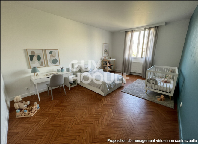
Proposition d'aménagement virtuel non contractuelle