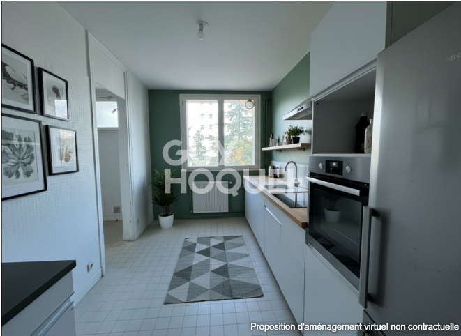
Proposition d'aménagement virtuel non contractuelle