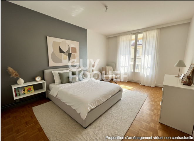
Proposition d'aménagement virtuel non contractuelle