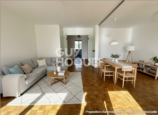
Proposition d'aménagement virtuel non contractuelle